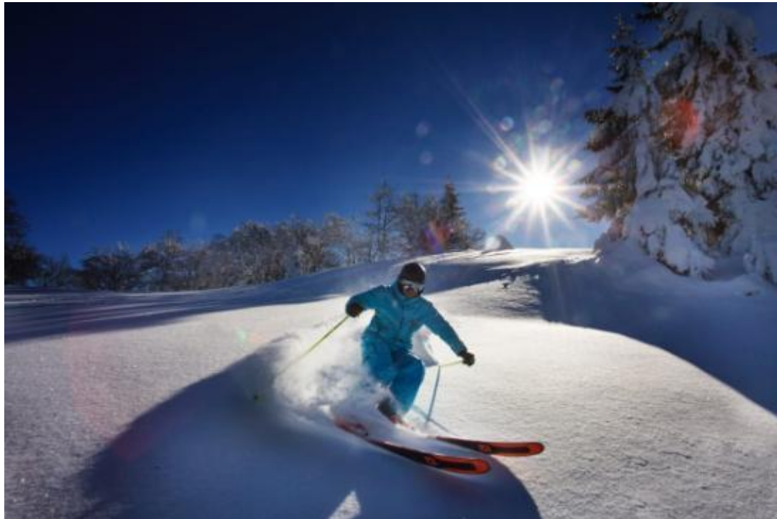
Métabief, station de montagne du Doubs