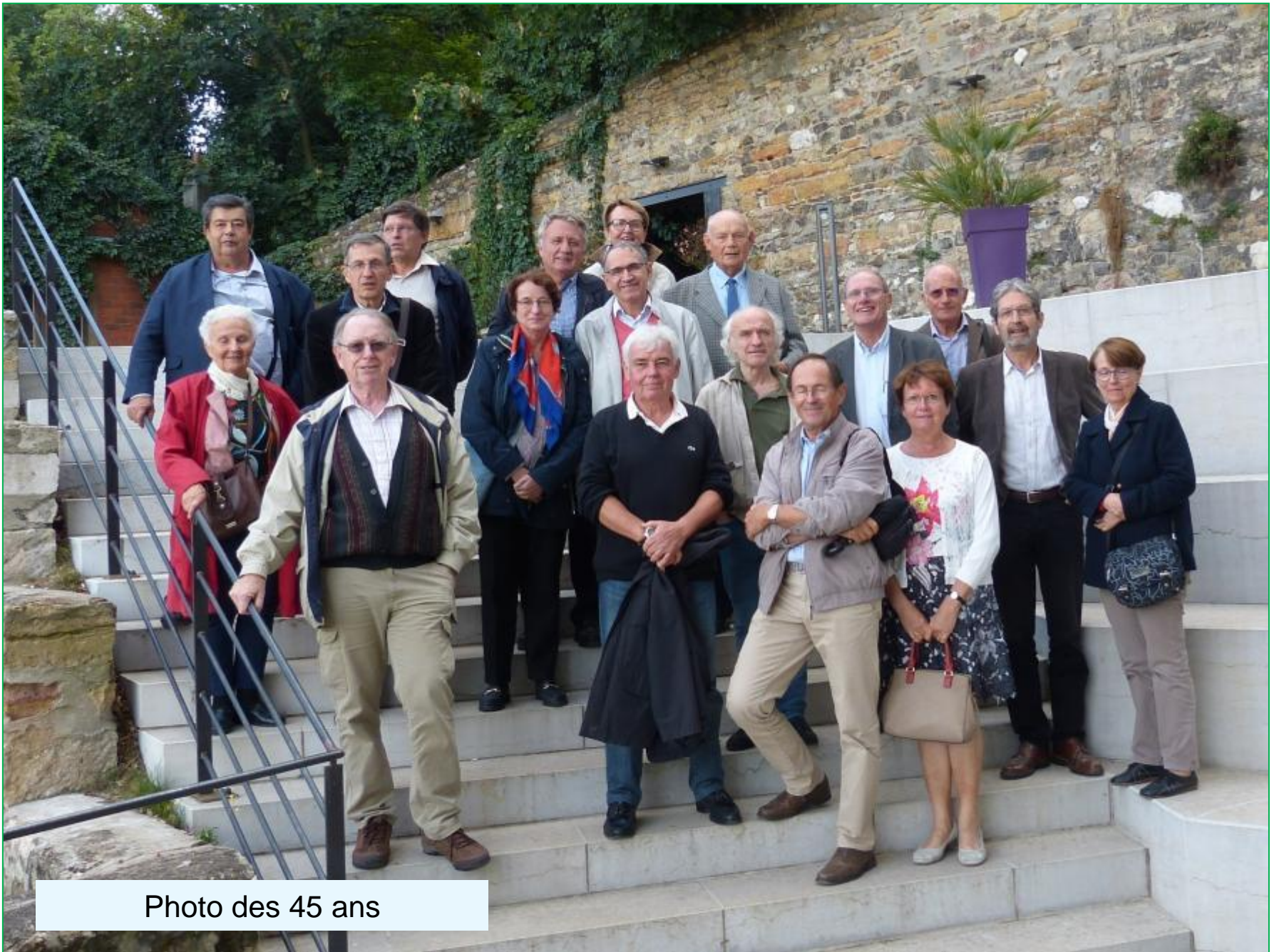
Photo des 45 ans