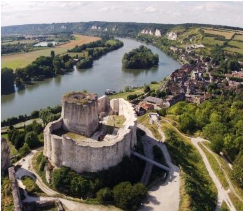
Château-Gaillard, Les Andelys (Eure)