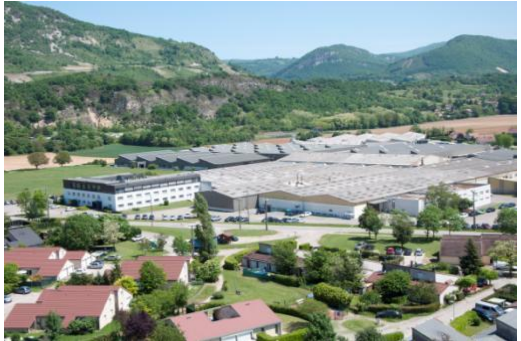
ROSET SAS à Briort (Ain)